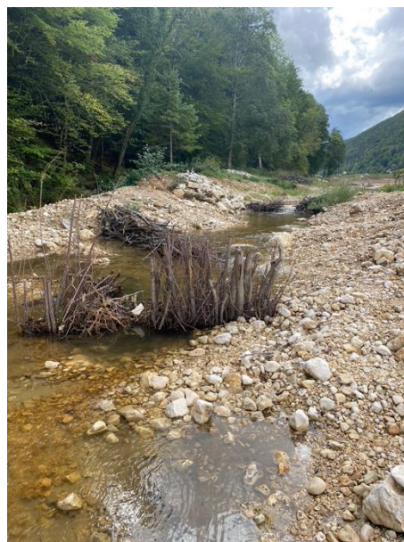
Dynamik am Fluss: Die Dünnern im Herbst 2022 und im Herbst 2024. Nicht nur die Ufervegetation wächst, auch der Bachlauf selber hat sich bereits wesentlich verändert.