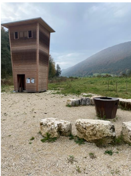
Beidseitig des Sitzkreises aus den Steinen des Sagibrüggli werden zwei Stieleichen gepflanzt.

Baum. Die Gemeinde Herbetswil, als diesjähriger Veranstaltungsort, hat mit Pro Natura vereinbart, dass anstelle eines grossen Baumes irgendwo im Siedlungsgebiet zwei Eichen gepflanzt werden, welche die Grillstelle flankieren und so den Schatten spenden, der bisher dort vermisst wurde.